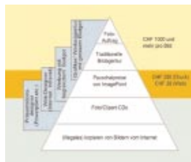
Die Realität im Bildermarkt: Kunden und Angebote im Wandel

Die Online-Bildagentur ImagePoint ist erst seit Ende 2002 aktiv auf dem Markt. Das Geschäftsmodell wird gut aufgenommen: Kunden aus Werbung, Redaktionen und Webdesign beziehen ihre Bilder direkt über die Internet-basierte Plattform.